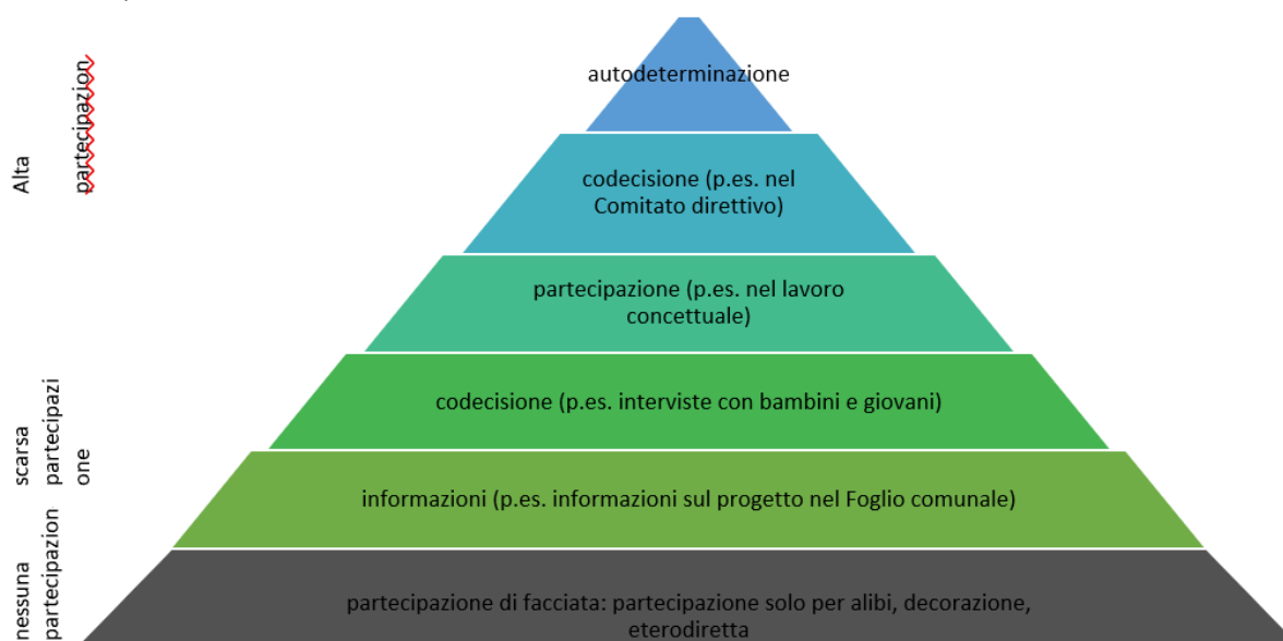
Illustrazione: piramide della partecipazione (sul modello di Arnstein (1969) e Hart (1992)).

All'inizio, definite per ogni fase progettuale chi viene coinvolto in che cosa, perché, quando, come (e in quale misura). Esistono vari livelli di partecipazione. Il modello seguente fornisce una panoramica dei vari livelli (illustrazione 3).